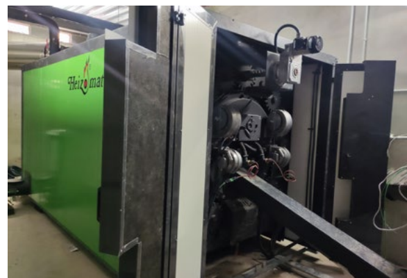
La caldera de biomassa està a punt per fer proves.

L'Ajuntament participa des de fa anys en el programa Passa l'energia! de la Diputació que consisteix en aplicar mesures d'estalvi energètic en alguns equipaments i els estalvis econòmics generats es reinverteixen en més millores i en lluitar contra la pobresa energètica. A més, està elaborant amb el Consell Comarcal un pla d'adaptació al canvi climàtic, que és un dels tres eixos del Pla d'Acció d'Energia Sostenible i el Clima.