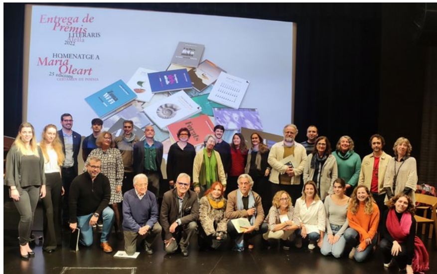
Foto de família amb algunes de les persones que han estat premiades o han format part del jurat del premi Maria Oleart.

L'Espai d'Arts Escèniques Casal d'Alella va acollir el 18 de novembre l'acte de lliurament dels Premis Literaris d'Alella. Enguany aquesta cita literària tenia una rellevància molt especial: la celebració del 25 aniversari del premi de poesia Alella a Maria Oleart, que va ser l'inici d'aquests certàmens literaris, als que s'afegiria quatre anys després el premi de contes Alella a Guida Alzina, que aquest any celebra la seva 21a edició.