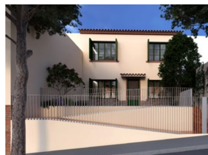
Imatge virtual de l'edifici de les “cases dels mestres”.

es generaran dues llistes una destinada a persones amb discapacitat reconeguda amb problemes de mobilitat i una altra per a la resta que reuneixen els requisits. El preu del lloguer serà de 500 euros —actualitzat anualment amb l'IPC— i el contracte es farà per un període de cinc anys, prorrogables tres més si no hi ha variacions en la situació. alella.cat/habitatge