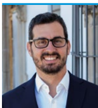
L'alcalde, Marc Almendro Campillo

Acabem d'aprovar el pressupost municipal per a l'any 2023. Un pressupost molt complex que ha hagut d'assumir, d'una banda, els increments de costos generalitzats i, d'altra, la disminució d'ingressos. Enguany, presentar i aprovar el pressupost 2023 ha estat una tasca que ha requerit un gran esforç del govern municipal, què hem assumit amb consciència de la responsabilitat que tenim al capdavant de l'Ajuntament.