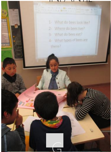
G E P