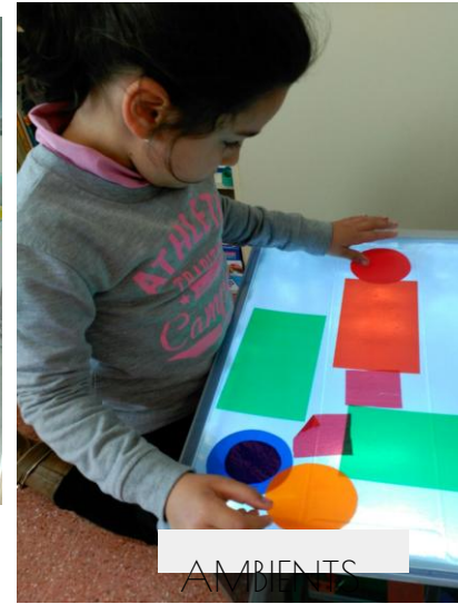
AMBIENTS A INFANTIL