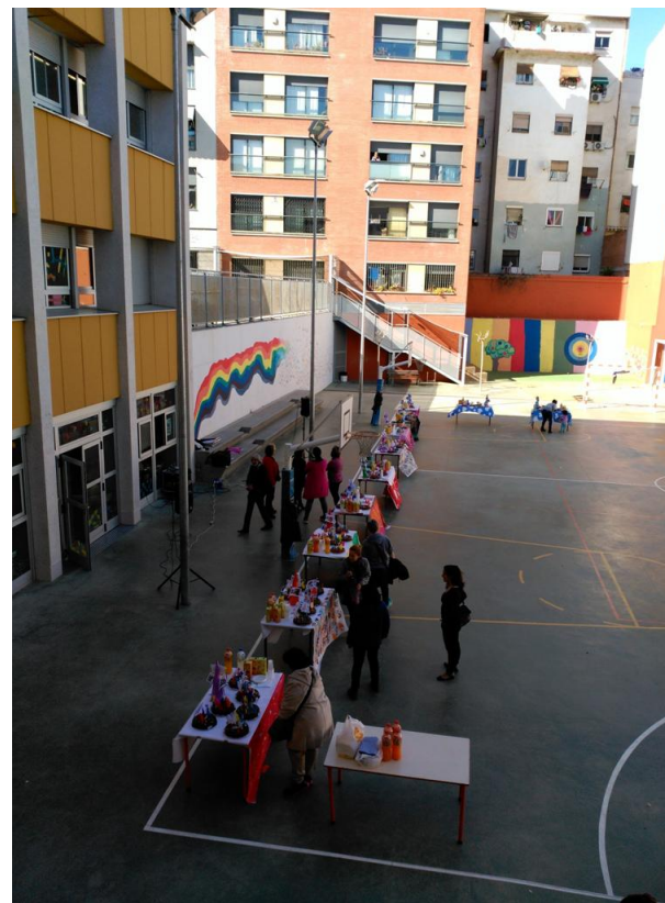
FESTA DE PASQUA