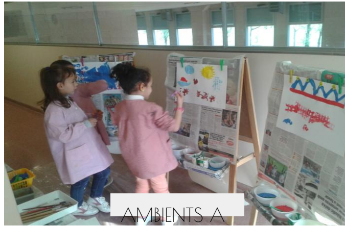
AMBIENTS A INFANTIL