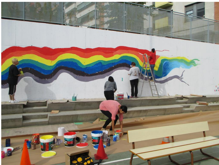
Pintada al pati