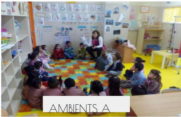
AMBIENTS A INFANTIL